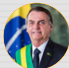
AUTOR: Presidência da República

Promulgação do PLN 2/2021 (Lei Ordinária nº 14.143 de 2021) – Mudanças na Lei de Diretrizes Orçamentárias