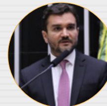
Dep. Celso Sabino (União-PA) 3º Secretário