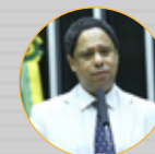
RELATOR: Dep. Orlando Silva (PCdoB-SP)

Sanção do PLP 420/2014 – Lei da Empresa Simples de Crédito e Inova Simples – Lei Complementar nº 167 de 2019