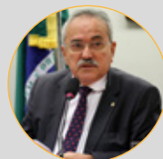
Dep. Átila Lira (PP-PI)