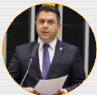
Dep. Tiago Dimas (Podemos-TO) Articulação Política na Câmara