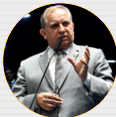
Sen. Izalci Lucas (PSDB-DF) Vice-Presidente Senado Federal