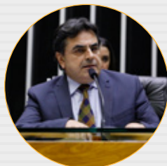
Dep. Domingos Sávio (PL-MG) Vice-Presidente