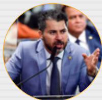
Sen. Marcos Rogério (PL-RO) Articulação Política no Senado