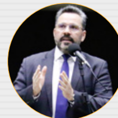
Dep. Alan Rick (União-AC) 2º Vice-Presidente da Região Norte