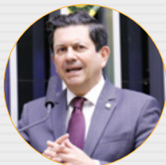
Dep. Otavio Leite (PSDB-RJ) 2º Vice-Presidente da Região Sudeste