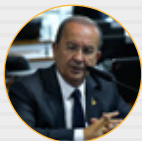
AUTOR: Sen. Jorginho Mello (PL-SC)

Promulgação do PLP 46/2021 (Lei Complementar nº 193 de 2022) – Refis da Micro e da Pequena Empresa