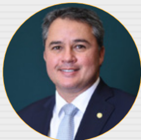
Dep. Efraim Filho (União-PB) Presidente