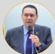
Dep. Vitor Lippi (PSDB-SC)