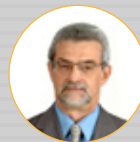
AUTOR: Dep. Pedro Eugênio (PT-PE)

Sanção do PLP 420/2014 – Lei da Empresa Simples de Crédito e Inova Simples – Lei Complementar nº 167 de 2019