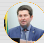
RELATOR: Dep. Jerônimo Goergen (PP-RS) (CFT)