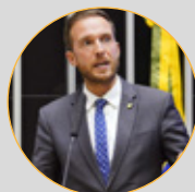
Dep. Vinicius Poit (NOVO-SP)