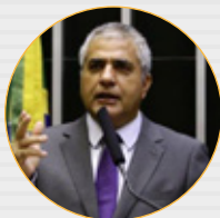
Dep. Christino Aureo (PP-RJ) Coordenação de Assuntos Tributários