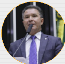
Dep. Darci de Matos (PSD-SC) 1º Secretário