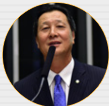
Dep. Luiz Nishimori (PSD-PR) 4º Secretário