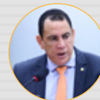
RELATORA: Dep. Da Vitoria (PP-ES) (CFT)