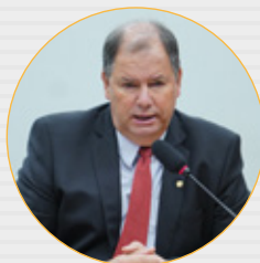
Dep. Alceu Moreira (MDB-RS) 2º Vice-Presidente da Região Sul