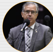
Dep. Joaquim Passarinho (PL-PA) 2º Secretário