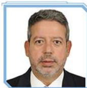
Arthur Lira Deputado Federal e Presidente da Câmara dos Deputados *