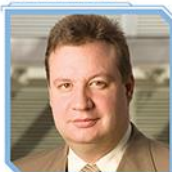
Luiz Rabi Serasa Experian