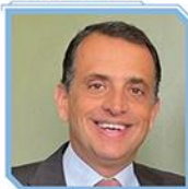
Marco Bertaiolli Deputado Federal (PSD-SP) e membro da FCS