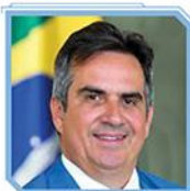
Ciro Nogueira Ministro-chefe da Casa Civil *