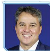
Efraim Filho Deputado Federal (União-PB) e Presidente da FCS